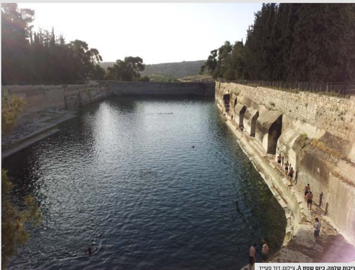
בריכות שלמה, כיום שטח A.

בימי בית שני, המשנה והתלמוד התקיימה מערכת אמות, צינורות, מנהרות, נקבות ובריכות שסיפקה מים מהר חברון לירושלים והייתה בשימוש עד למלחמת העצמאות והוסיפה לספק מים לחלק המזרחי של העיר עד מלחמת ששת הימים.