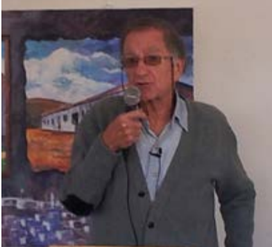
פרופ'רפי ישראלי מרצה בשדמה.

את תואר "ההוגנים ביותר" מעניק פרופ' ישראלי לאנשי החמאס משום הישירות שבה הם מבהירים כי לעולם לא יכירו בישראל ונכונותם היא לכל היותר ל'הודנה' עם ישראל ולא כל מהלך שהוא מעבר לכך