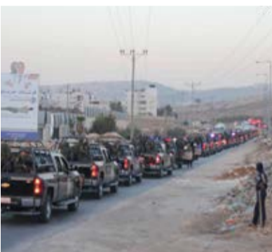
שוטרים פלשתינים. לא בקלות יוותרו הפלשתינים על תמניו שלטונם.

פרופ' קנטרוביץ' מאוניברסיטת שיקגו בהרצאה בשדמה שבגוש עציון: מאיימים עלינו שאם לא נקבל את רעיון שתי המדינות נצטרך לקיים את הרעיון של מדינה אחת, אבל הרעיון הזה אמור להפחיד אך ורק את הפלשתינים עצמם, והם יודעים זאת היטב.