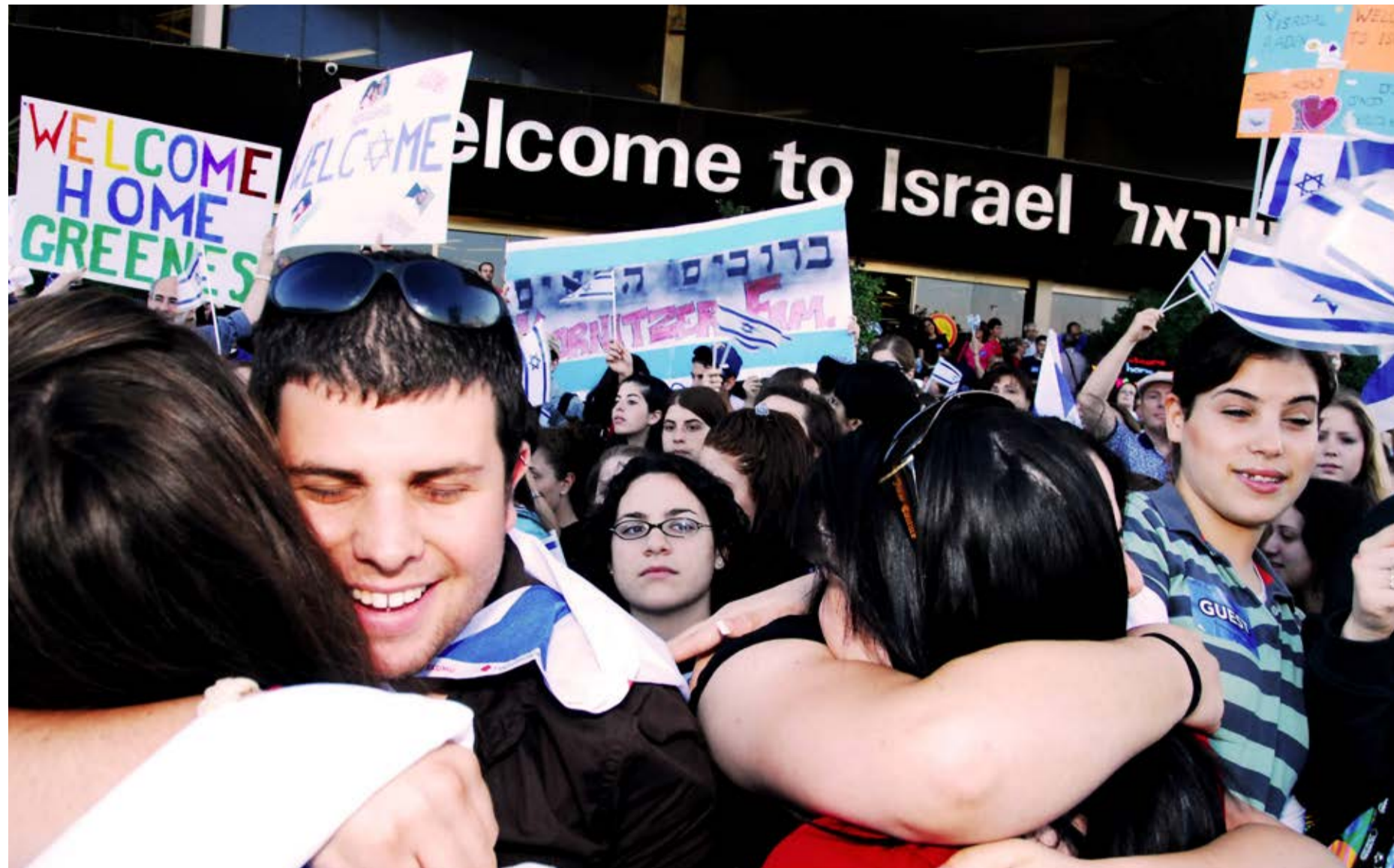
עולים לארץ ישראל