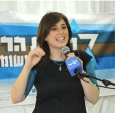
ס' השר ציפי חוטובלי בכנס ריבונות 2 של נשים בירוק, חברון, תמוז תשע"ב, 2012.

היעד הוא שיהודה ושומרון יהיו בריבונות ישראל. זה שלנו וזה הושג כרת וכדין