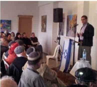
פרופ' יוג'ין קנטרוביץ' מרצה בשדמה.

לעומת קשיי המדינה האחת רעיון שתי המדינות הוא מתווה לאסון ברור עבור מדינת ישראל.