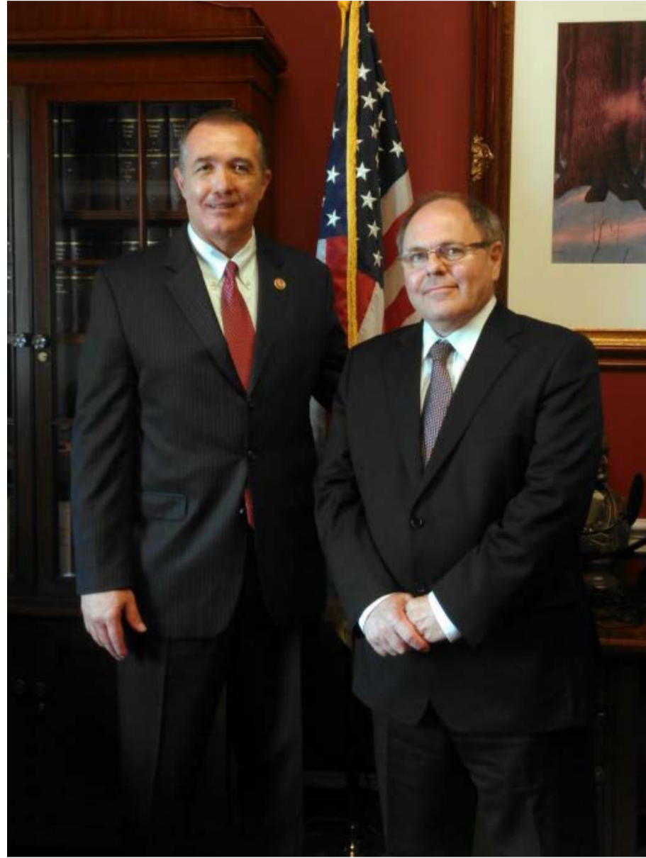
דני דיין עם חבר הקונגרס טוטס פרנקס.

על פני זה נראה כמעט מאבק חסר סיכוי "אחרי נאום בר אילן התייצתי עם דיפלומט